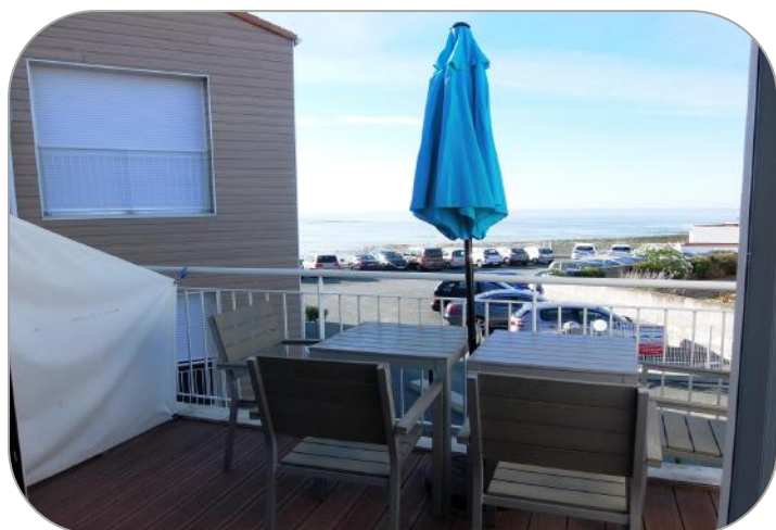
Vue du 12 bis