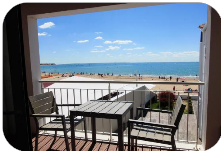
Vue du 11