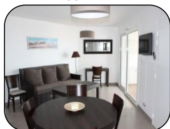
Appt 12 bis