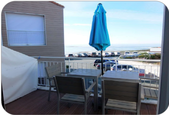
Vue du 12 bis