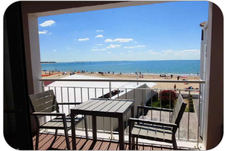
Vue du 11