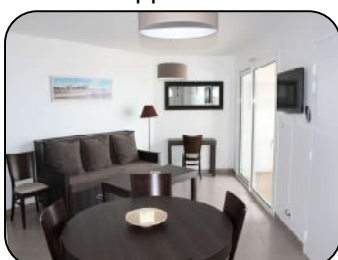
Appt 12 bis